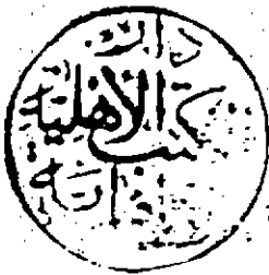
صورة العنوان من النسخة (م) وهي المنتقى من الفوائد

جزر منتقى من العوائد المستفاه العوائد العوالي ماسعا الى الحسن الدارقطني من حديث ابي اسحاق و ابراهيم بن محمد بن يحيى المزكي النسا بوري و من حديث ابي بكر احمد بن حنبل ابراهيم بن القطيعي رواه ابي طالب محمد محمد بن ابراهيم بن عثمان بن النزاز عن ابيه و ابيه الرئيس امين الحضرة ابي العباس عنه الله بن محمد الحضرت الشيا في عنه رواه الشيخ الامام الثقة الطالع ابي الحسن علي بن ابراهيم الواسطي عنه رواه الشيخ الامام الخاف ابي الحسن علي بن خلف الكوفي عنه بقراءة عليه رواه فخر رحمه الله بن محمد الجليلي محمد بن عبد الله الطحاوي عنه اجازة