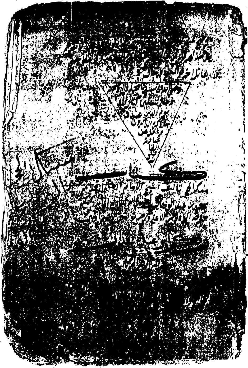
مهدية للصحة الذرية مع المنهجية