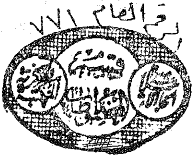
صورة الصفحة الاولى من النسخة ب