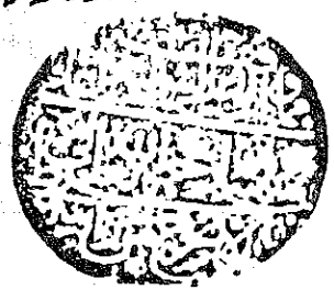
صورة الصفحة الأخيرة من النسخة آ

هذا الكتاب هو كتاب الفقه في الفقه الحنفي وهو من كتب الفقه المشهورين في بلادنا وهو من كتب الفقه المشهورين في بلادنا