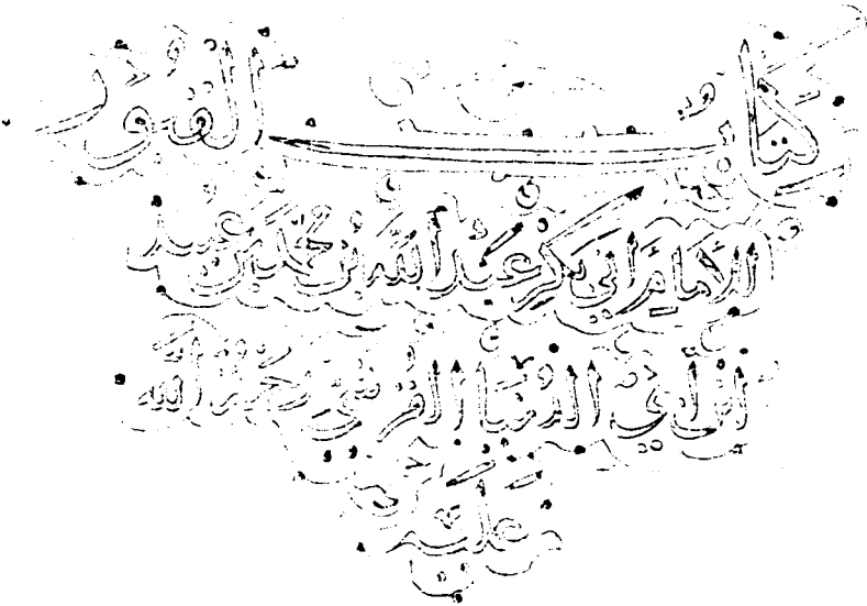
صورة من طرة، نسخة، الخطوط