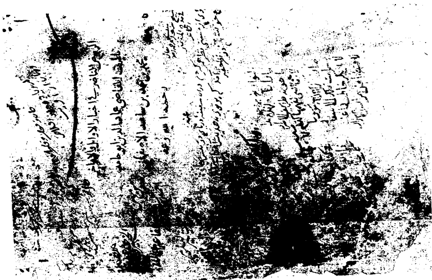
عنوان نسخة أكسفورد رقم «١٧٢» «الروض الناضر في أخبار الأوائل والأواخر» تأليف عماد الدين الأصفهاني