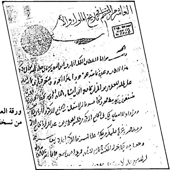
ورقة العنوان من الجزء العاشر من نسخة أحمد الثالث