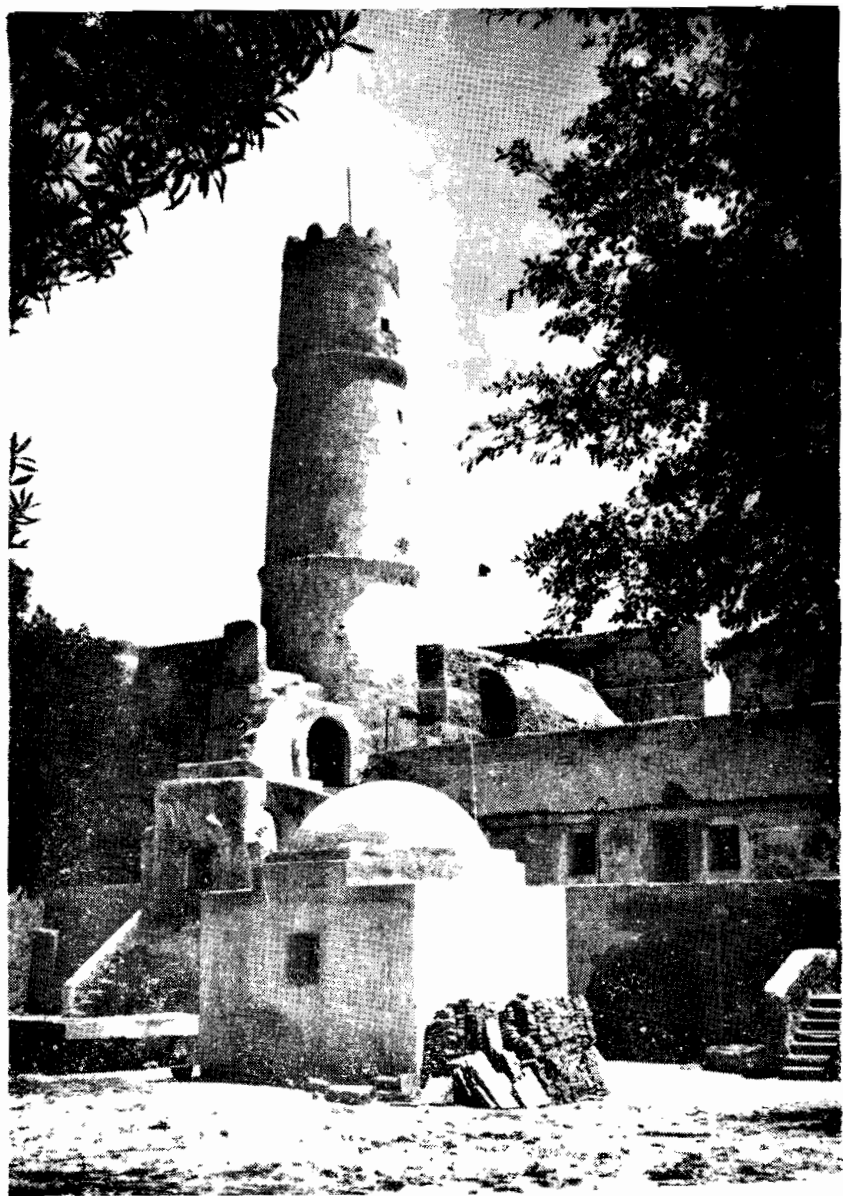
رباط المنستير . منظر من الداخل