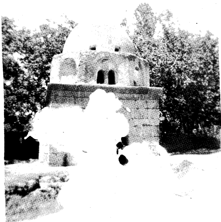
قبة قبر الشاعر المسجف في كفسوس انظر صفحة ٢٠١