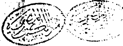
نموذج اللوحة الأخيرة من صورة المخطوط وبها تظهر نهاية المخطوط وتاريخ الفراغ من تأليفه - وافق الفراغ من تعليقه أواخر رمضان المعظم سنة اثنين وثلاثين ومائة وألف .