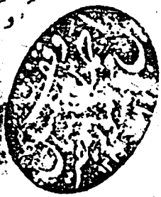
الصفحة الأخيرة من المخطوطة

بن نوفل مائة سنة وخمسة عشر سنة وقال ابو نوح كان لشرح بن الحارث القاضي يوم مات مائة وثمانين سنة وقال زائدة بن قدامة عتبة بن ربيعة ابن ارضين ومائة سنة انشكر الجزوه وجز من عاش مائة وعشرين سنة من الصباية وفي القوم عنهم من جمع الحافظ الى اوكروا حتى الوهاب بن محمد الاضنهاني رحمه الله عليه وعلقه لنفسه يونس بن ملاح الحسني المتوفى غر الله له ولوالديه ولشايخه والمسلمين ولا حول ولا قوة الا بالله العلي العظيم