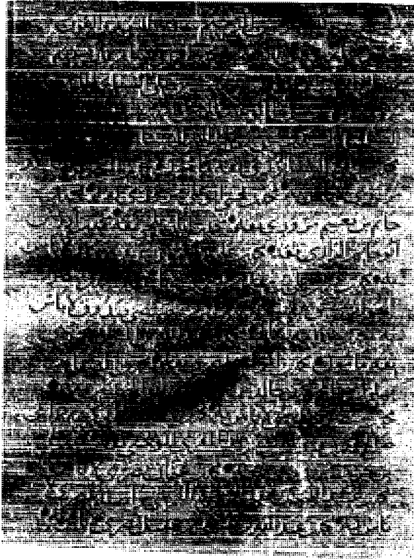
الورقة الأولى من المخطوطة