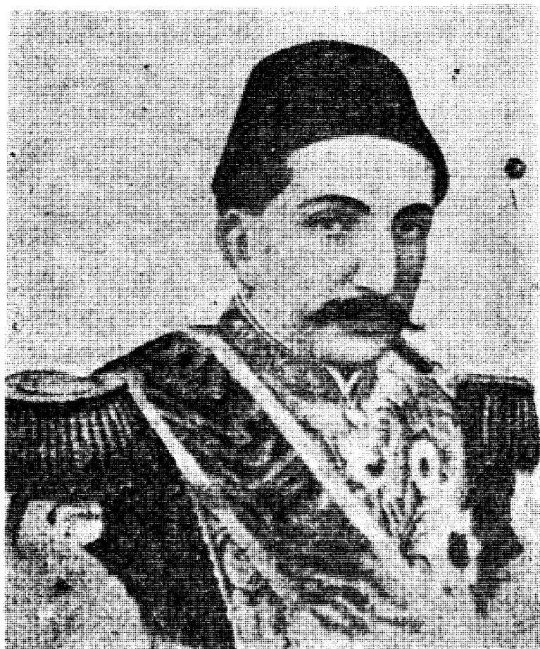
( السلطان عبد الحميد الثاني في شبابه )