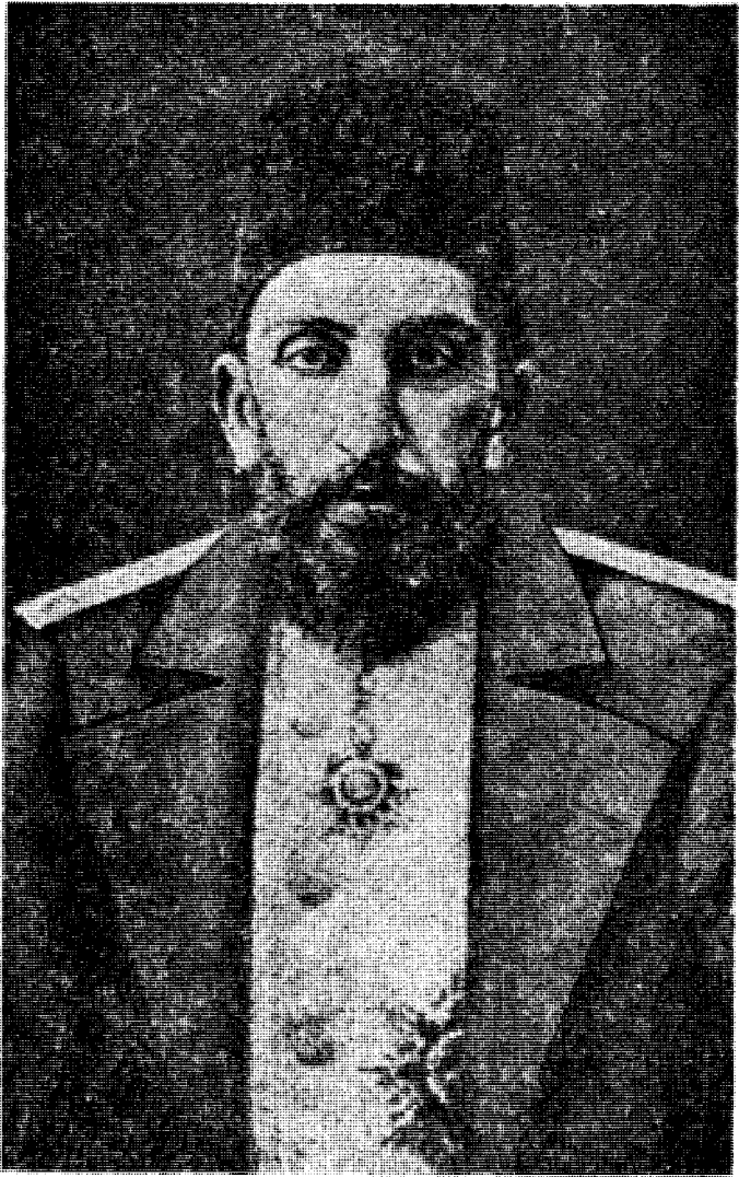
(السلطان عبد الحميد الثاني)