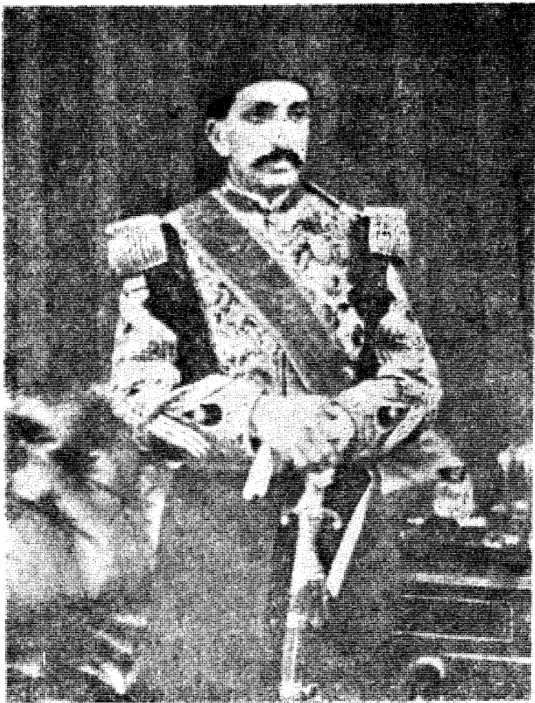
( السلطان عبد الحميد الثاني في شبابه )