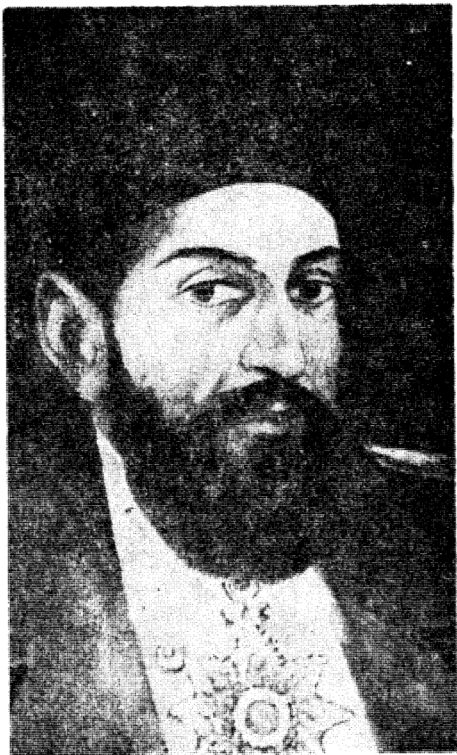
( السلطان عبد الحميد الثاني )