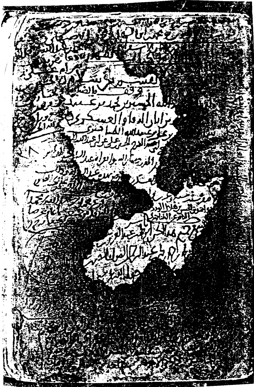
صورة عن اللوحة الأولى من نسخة (ب)