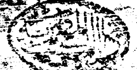
صورة عن اللوحة الأخيرة من نسخة (ب)