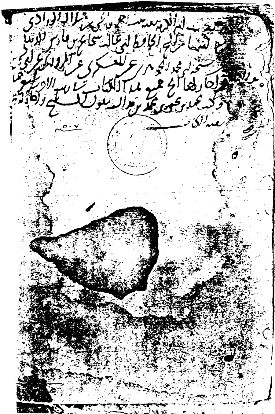
صورة عن اللوحة الأخيرة من نسخة (ب)