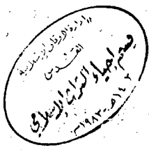
صورة الورقة الأخيرة من النسخة " ج "

وكتبها على احوال الاجفال العراة لانا كنا نعرف فيها اجلي سيدنا من اهل البيت من شاله وطحا حاتم