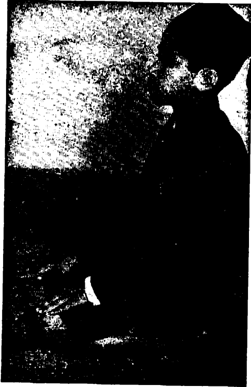
الجلوس لقراءة التشهد