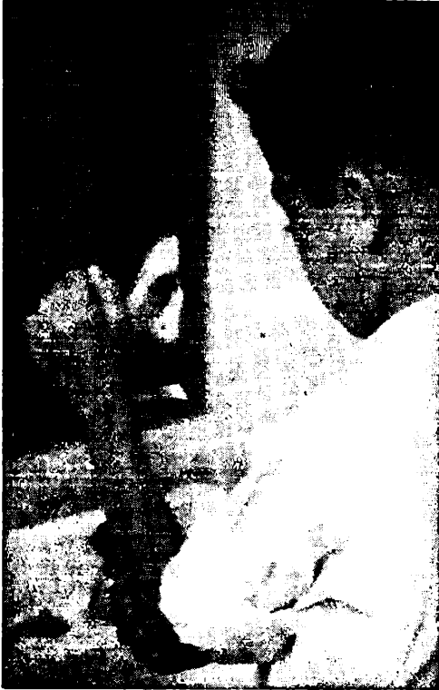
غسل اليدين الى المرفقين