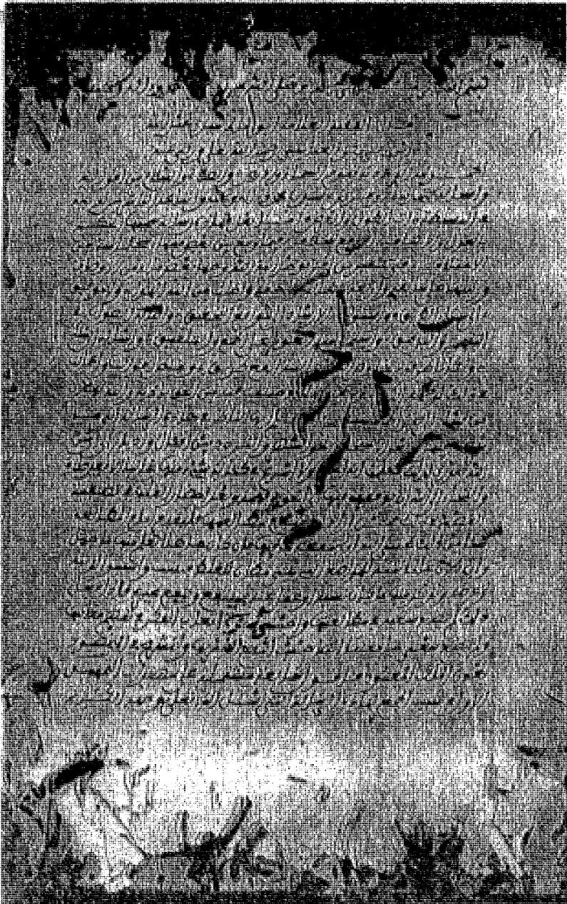
- الصفحة الأولى من نسخة القرآنة الملكية -