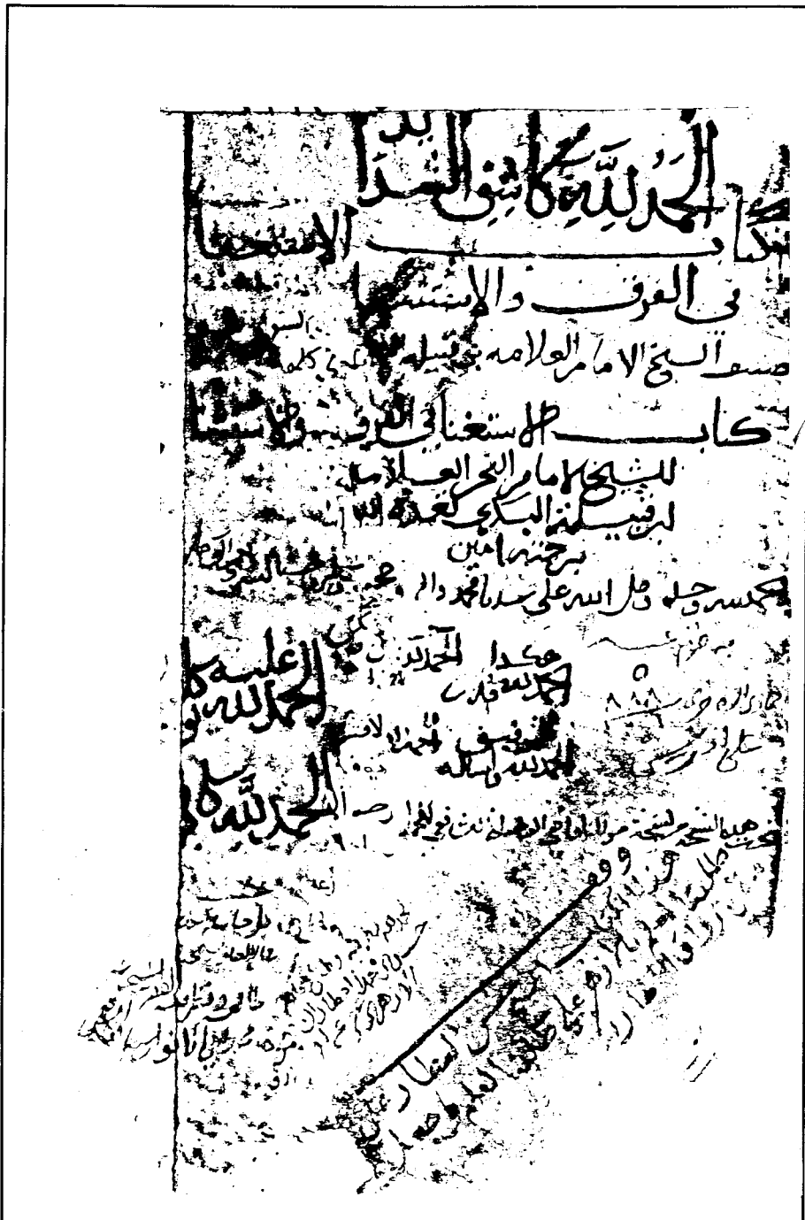
صورة الورقة الأولى من مخطوطة (ب) المحفوظة برواق المغاربة في مكتبة الأزهر الشريف.