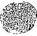
آخر لوحة من النسخة التركية «ب»