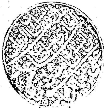
صورة الصفحة الأخيرة من نسخة (س)