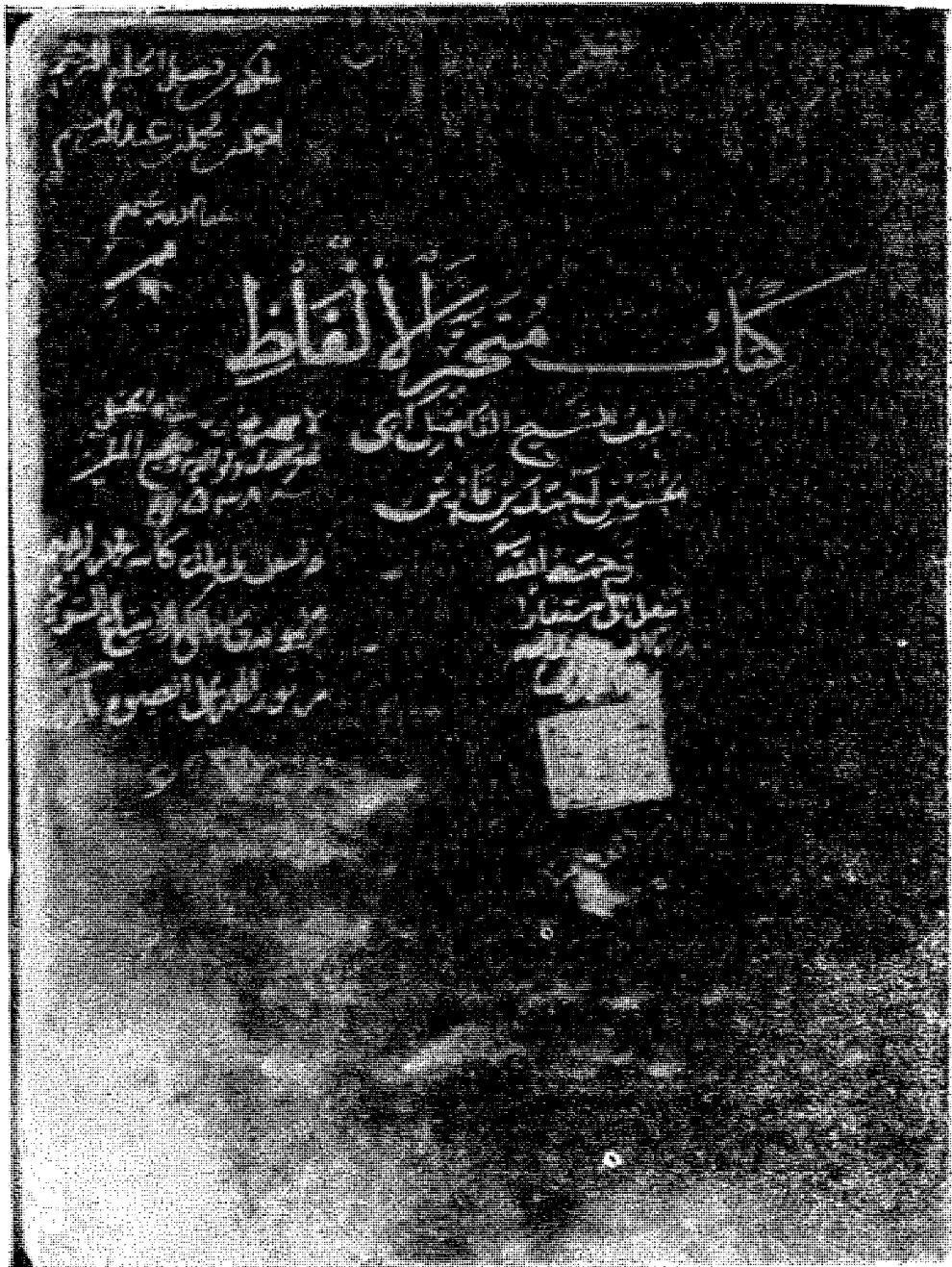
ورقة العنوان في المخطوطة الأم وعليها اسم الكتاب واسم المؤلف وبعض التمليكات