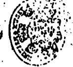
صورة لنهاية الكتاب في المخطوط

منه ليدل على ان كل ما في الدنيا من علم او مال او قوة فهو لله تعالى ولي رزقنا من حيث نشاء ولا اله الا هو العزيز الحكيم منه ليدل على ان كل ما في الدنيا من علم او مال او قوة فهو لله تعالى ولي رزقنا من حيث نشاء ولا اله الا هو العزيز الحكيم منه ليدل على ان كل ما في الدنيا من علم او مال او قوة فهو لله تعالى ولي رزقنا من حيث نشاء ولا اله الا هو العزيز الحكيم