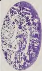
صورة الصفحة الأخيرة من النسخة (ج)