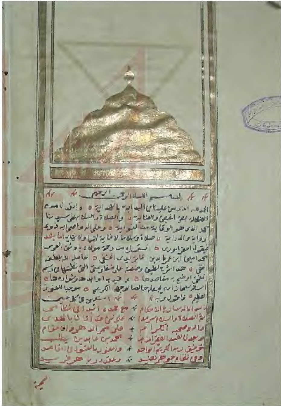
صورة الصفحة الأولى من النسخة (د)