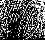
الورقة الأخيرة من النسخة الأصل

الشيخ الفاضل شيخنا الميرزا محمد باقر في شهر ربيع الثاني سنة ١١٠٠