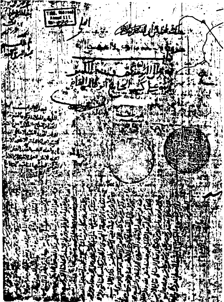
صورة الورقة الأولى من النسخة الخطية